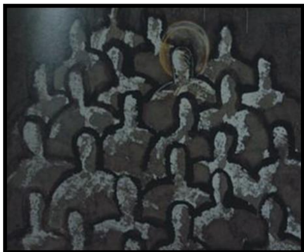
Saint and 24 Disciples (2006) 89X97 cm