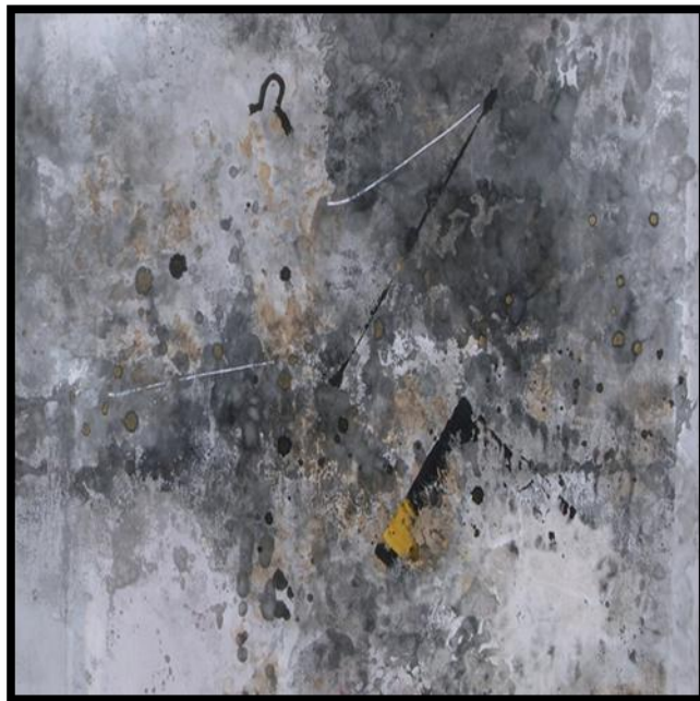
Maya 04 (2010) 123X119 cm