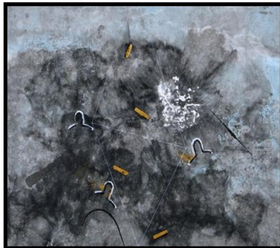
Dreamland 07 (2010) 123X119 cm