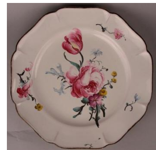
Faïences datées d'autour de 1745